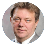
Иван Григорьевич Кляйн, мэр г. Томска